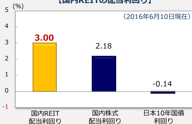
【国内REITの配当利回り】